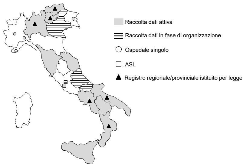
Figura 3. Istituzioni partecipanti al Registro Italiano ArthroProtesi (1° settembre 2020)

In Figura 3 sono riportate le istituzioni partecipanti al RIAP al 1° settembre 2020.