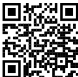
Figura 2. QR code associato a https://www.immuni.italia.it/dashboard.htm

Per utilità del lettore si riporta il Quick Response code (QR code) (Figura 2) di tale indirizzo ed il print screen (Figura 3) di tale indirizzo aggiornato al momento della stesura dell'aggiornamento di questo rapporto.