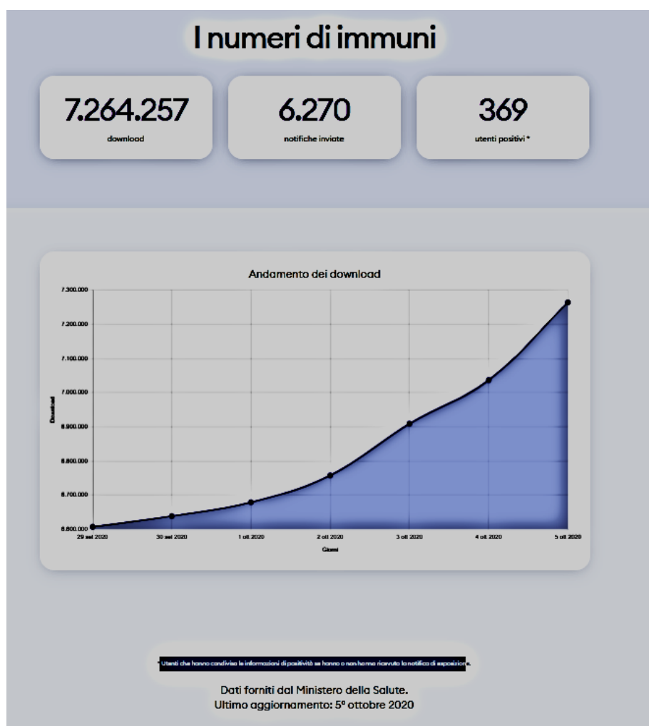
Figura 3. Print screen dall'indirizzo https://www.immuni.italia.it/dashboard.html come esempio (il QR code permette di leggere aggiornamenti ulteriori rispetto a quelli riportati in questo rapporto)