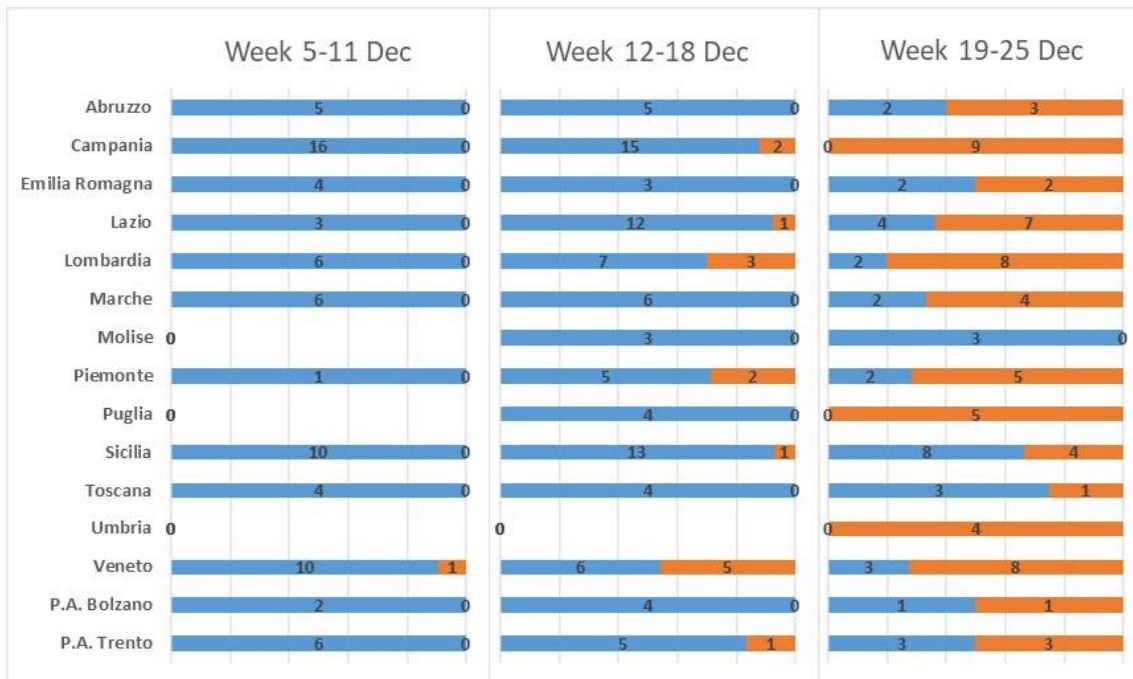
Figure 3: Occurrence of Omicron variant in the different Regions/Autonomous Provinces in the three weeks of the survey

Note: The Region of Liguria was not included in the graph as only two samples were available for the period of the study