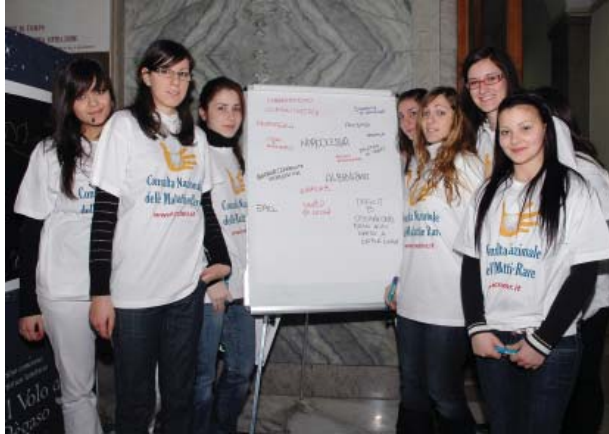
Gli artisti del "Muro simbolico"/Artists of the "Symbolic Wall"

Accanto alle parole e ai disegni dei concorrenti è stata inoltre organizzata la Tavola rotonda "Malati in prima pagina. Racconti difficili di storie rare", cui hanno partecipato alcune tra le firme più importanti del giornalismo italiano. Nessuna voglia di protagonismo, parlare delle centinaia di migliaia di persone con MR significa, al contrario, sostenere la loro battaglia per i diritti e per una migliore qualità di vita.