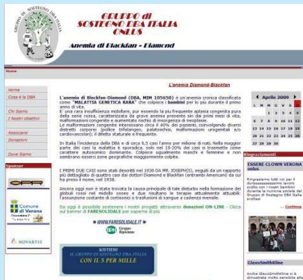
Home page del sito web del gruppo di sostegno Anemia di Diamond-Blackfan Onlus

L'obiettivo cardine del Gruppo è quello di fornire sostegno ai malati di DBA e ai loro parenti, riunendo