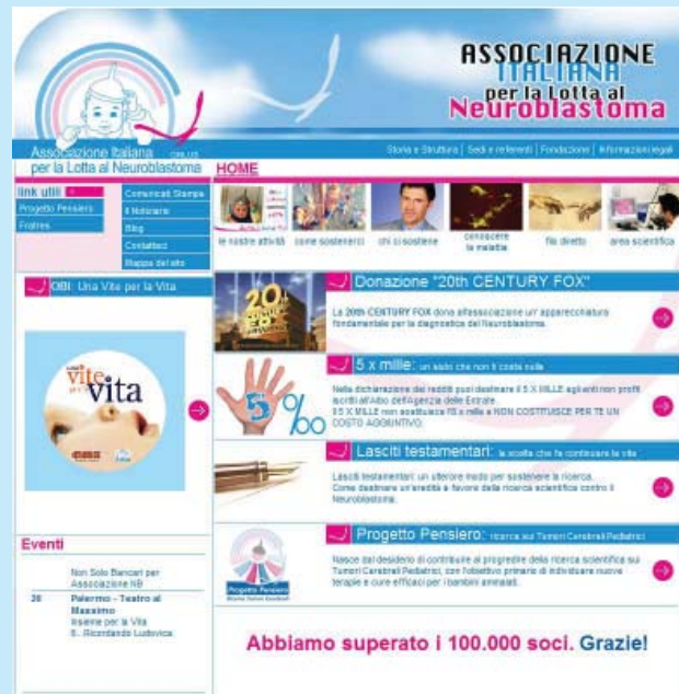
Home page del sito web dell'Associazione Italiana per la Lotta al Neuroblastoma

Gli obiettivi principali, su cui si concentrano l'attenzione e le attività dell'Associazione, sono volte non soltanto a sostenere la ricerca scientifica sui