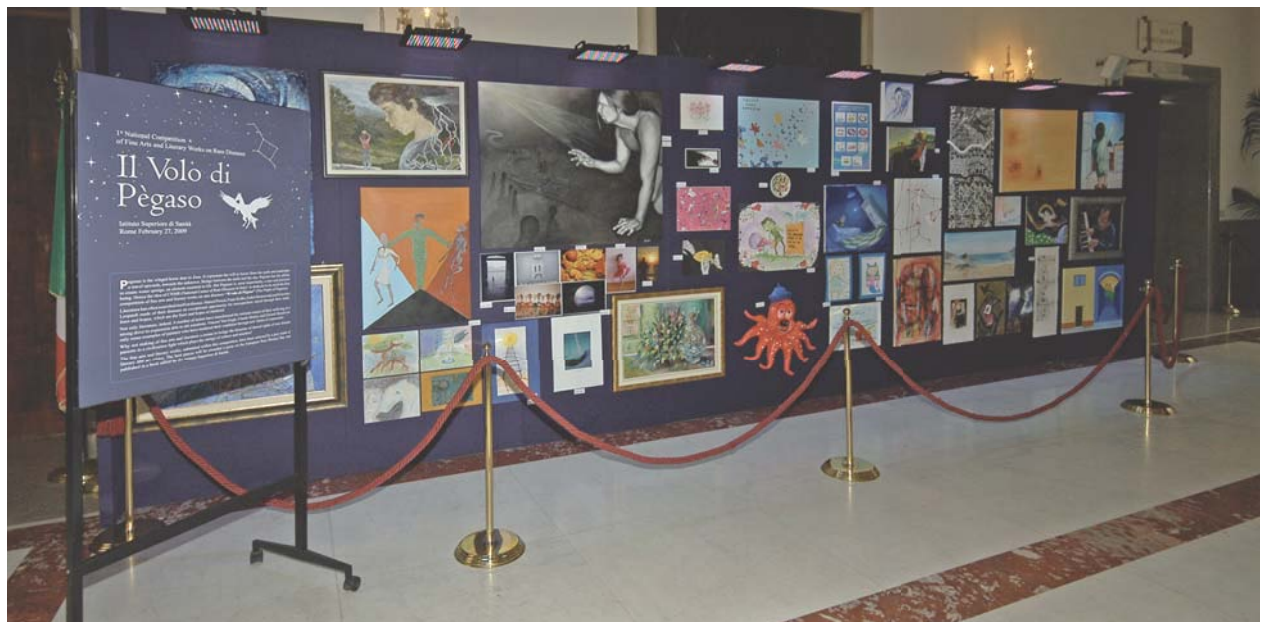
La mostra di pittura de "Il Volo di Pègaso"/Drawing exhibition "Il Volo di Pègaso"

T his year too, as it happened in 2008, the World Day for rare diseases has been celebrated. It was an international happening involving a growing number of people and institutions. The National Centre for Rare Diseases (CNMR) gave its contribution to this event by organising several spaces of reflexion, study and discussion. The artistic-literary award "Il Volo di Pègaso, the narrative of rare diseases" took place during the event. It was competition organised by the CNMR aiming at facilitating reflexions about the quality of life of the people affected by rare diseases through narrative, drawing, poetry and sculpture. During the awarding session, actors of national fame interpreted some of the stories awarded. Furthermore, there were drawings, sculptures, paintings of those who contributed to the success of "Il Volo di Pègaso". ▶