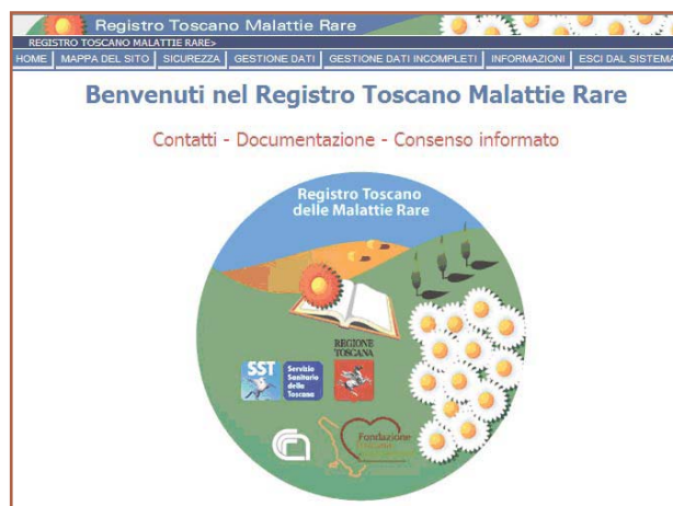
Figura 1 - Home page del Registro Toscano delle Malattie Rare ( www.rtmr.it )

L'accesso al sito Internet per la registrazione dei casi di MR ( https://bmf01.ifc.cnr.it/rtmr ) è protetto e dedicato e avviene tramite login e password assegnate ai medici professionisti dei Presidi in cui vengono erogate prestazioni sanitarie diagnostico-terapeutiche per pazienti affetti da MR. L'assegnazione della login di accesso viene effettuata dietro segnalazione dei membri del gruppo di coordinamento o tramite richiesta diretta ai gestori del sito (Figura 1).