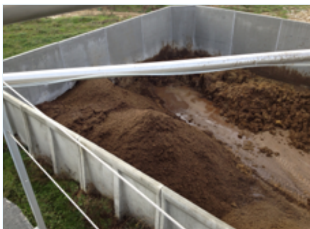
Foto 2 - Area di stoccaggio del digestato solido prodotto in un impianto per la produzione di biogas