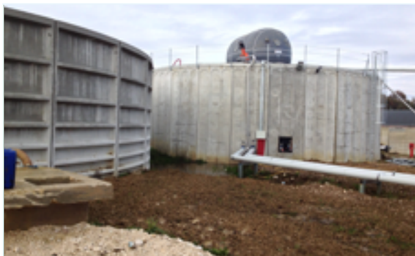
Foto 1 - Digestore di un impianto per la produzione di biogas

L'attività dei batteri metanogeni dipende dalla temperatura: al di sotto dei 10 °C è molto ridotta, mentre temperature superiori a 65 °C provocano la morte delle cellule. La temperatura ottimale per velocizzare la produzione di gas, e quindi minimizzare i tempi di ritenzione, si attesta tra 35 °C e 55 °C. Si possono distinguere due tipi di processo: mesofilo (30-38 °C) con durata di 14-30 giorni e termofilo (39-60 °C) con tempo di residenza nel digestore in genere inferiore ai 14-16 giorni.