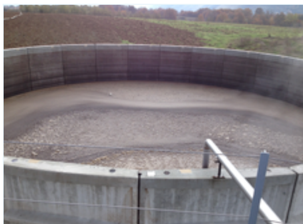
Foto 3 - Area di stoccaggio del digestato liquido prodotto in un impianto per la produzione di biogas

Dagli studi pubblicati dalla letteratura scientifica di settore si evince che nel digestore, durante la produzione di biogas, si selezionano comunità microbiche costituite in maniera preponderante da specie batteriche appartenenti al genere Clostridium . Tra queste assumono un ruolo di primaria importanza il Clostridium tyrobutyricum e il Clostridium butyricum , conosciuti anche per essere responsabili della comparsa di difetti nei formaggi e nelle conserve di pomodoro. In particolare, il Clostridium butyricum può costituire un pericolo per la salute pubblica in quanto già associato a casi di botulismo per acquisizione della capacità di produrre le tossine botuliniche. Per quanto riguarda il Clostridium botulinum e gli altri clostridi responsabili del botulismo, è bene precisare ►