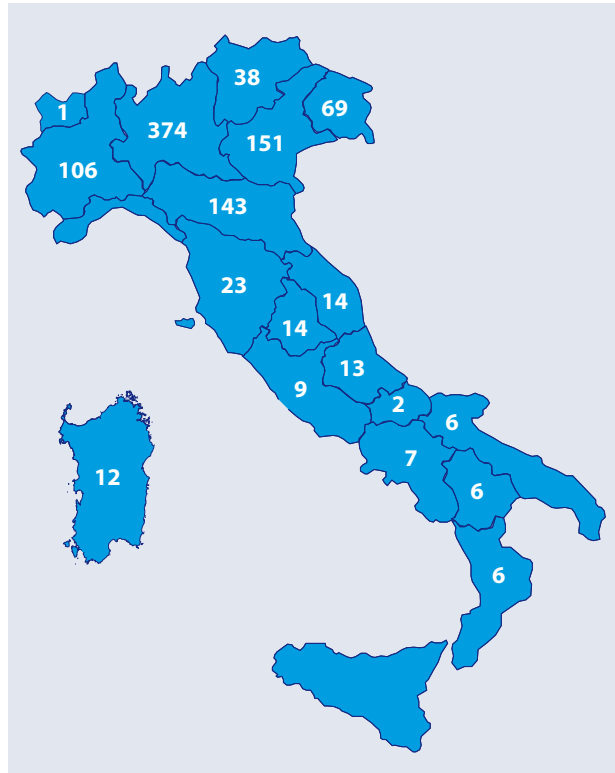
Figura 1 - Distribuzione geografica degli impianti di biogas presenti in Italia nel 2012

La produzione di biogas avviene mediante un processo di digestione anaerobica, un complesso meccanismo biologico di fermentazione per mezzo del