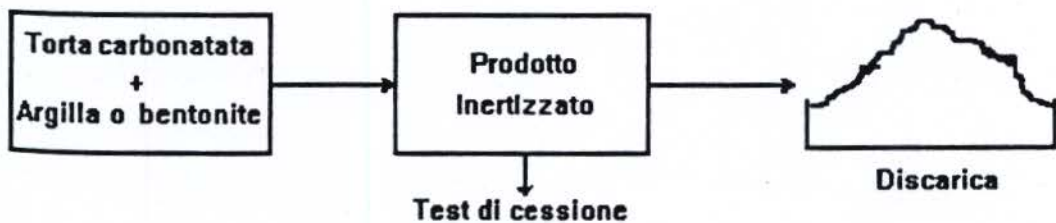
figura 2. Fasi di trattamento dei prodotti provenienti dal trattamento di fondami di serbatoio (vedi figura 1).