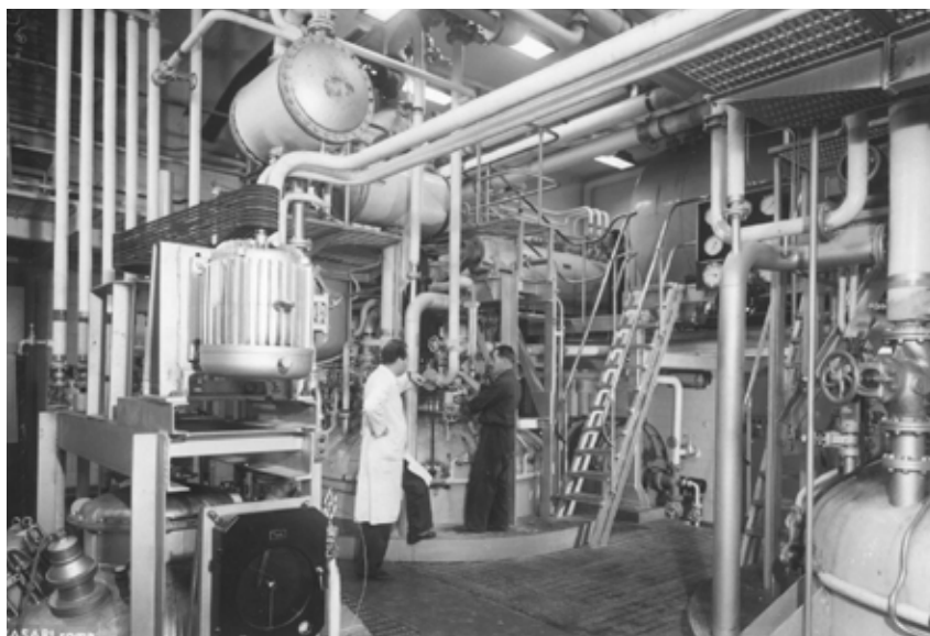
Fabbrica della penicillina, Istituto Superiore di Sanità, 1952