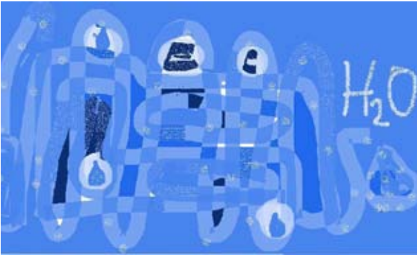
Logo del Convegno

medici, per le quali la qualità dell'acqua svolgeva un ruolo fondamentale per garantire la "bontà" del prodotto finito e la conformità ai requisiti previsti dalle norme di settore. Nell'arco di 24 mesi sono stati messi a punto protocolli dedicati e sono stati effettuati campionamenti e analisi microbiologiche, allo scopo di redigere una linea guida.