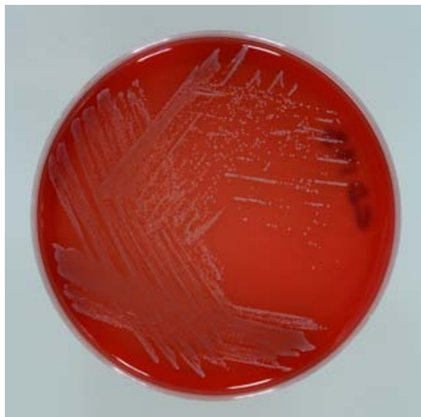
C. diphtheriae biotipo mitis , crescita su agar sangue

Nelle forme più gravi della malattia, causate dalla diffusione della tossina difterica nel sistema circolatorio, si possono avere complicanze sistemiche a carico del miocardio e del sistema nervoso periferico. La formulazione di un vaccino e le campagne di vaccinazione di massa in America (1920) e in Europa (1940) hanno favorito la quasi totale eliminazione della malattia nella maggior parte dei Paesi industrializzati. Tuttavia, esistono aree del mondo come l'Asia (Cina, India e Indonesia), il Sud-America e l'Africa dove la malattia è ancora endemica (1). Nonostante il grande successo ottenuto grazie alla somministrazione del vaccino, durante gli anni '90 numerosi episodi epidemici, anche di vaste proporzioni, sono stati riportati in Russia e nei Nuovi Stati Indipendenti (NSI) della ex-Unione Sovietica. La riemergenza della difterite in questi Paesi fu dovuta soprattutto a fattori di tipo sociali, economici, politici e sanitari, che hanno subito un importante e grave deterioramento in seguito alla disgregazione dell'Unione Sovietica, contribuendo alla diffusione della malattia (2).