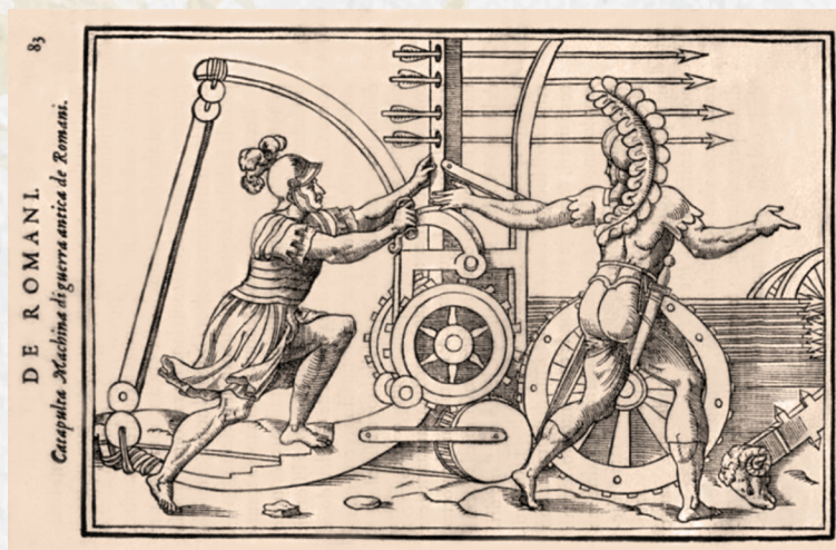
Guillaume Du Choul (sec. 16.). Discorso sopra la castrametatione, et disciplina militare de Romani... ,1569

D urante il Rinascimento il rinnovato interesse per il mondo classico spinse numerosi studiosi e intellettuali a recuperare, studiare e reinterpretare le conoscenze dell'antichità.