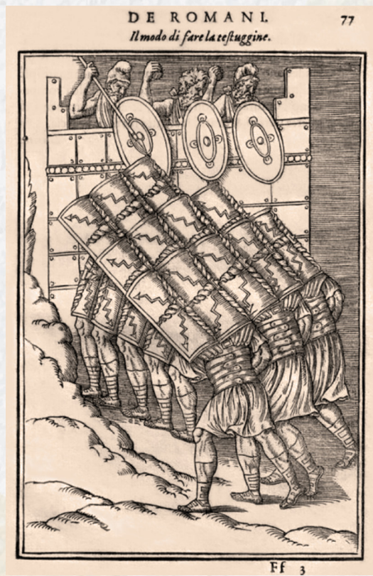
Figura 2 - Guillaume Du Choul (sec. 16.). Discorso sopra la castrametatione, et disciplina militare de Romani... , 1569

Nel saggio Discorso sopra la castrametatione, et disciplina militare de Romani , vengono descritte con precisione le pratiche militari romane, in particolare la castrametazione, ovvero l'organizzazione e la disposizione dei campi militari delle legioni, la loro architettura, la disposizione strategica delle tende, le mura difensive, le torri e i fos-