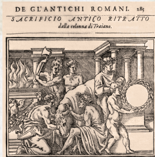
Figura 4 - Guillaume Du Choul (sec. 16.). Discorso della religione antica de Romani... , 1569

sati (Figura 5). L'autore si sofferma sull'efficienza, la disciplina e le tecniche di addestramento dei soldati romani, evidenziando come i loro accampamenti fossero progettati non solo per la difesa, ma anche per facilitare l'organizzazione interna e la logistica. Descrive inoltre le modalità di costruzione di strade, ponti e strutture temporanee.