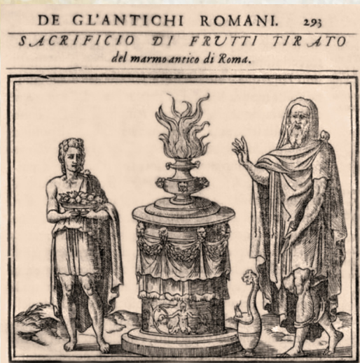
Figura 3 - Guillaume Du Choul (sec. 16.). Discorso della religione antica de Romani... , 1569