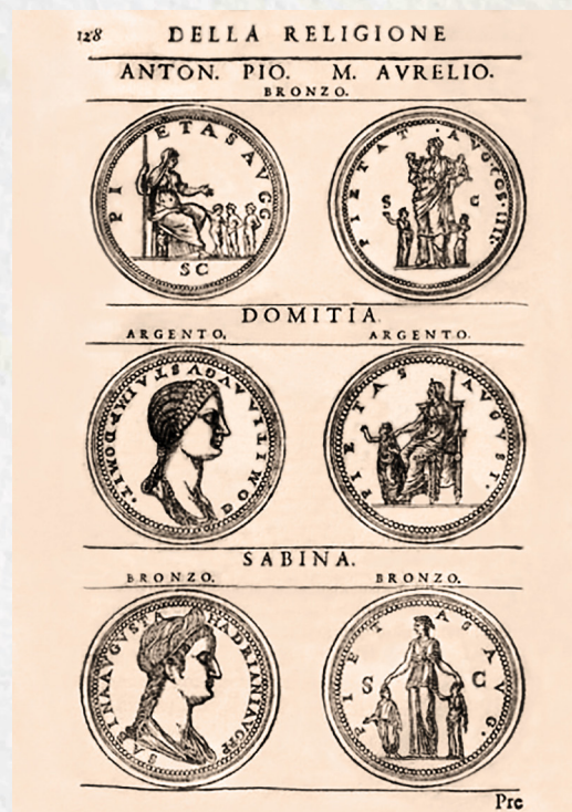
Figura 1 - Guillaume Du Choul (sec. 16.). Discorso della religione antica de Romani ... , 1569

Consigliere di Francesco I di Valois re di Francia e ufficiale in servizio presso l'antica provincia francese delle montagne del Delfinato, Du Choul fu un grande collezionista ed eminente numismatico, famoso oltre che per aver realizzato uno dei primi medaglieri documentato in Francia, anche per le sue preziose raccolte di gemme, conchiglie e antichi reperti archeologici; testimonianze storiche che contribuirono a restituire vita alle civiltà classiche (Figura 1). Questa passione, nata anche per effetto del territorio dove risiedeva ricco di resti archeologici, era alimentata dallo scambio di oggetti antichi con collezionisti risiedenti in Francia e in Italia; tale attività gli consentì di