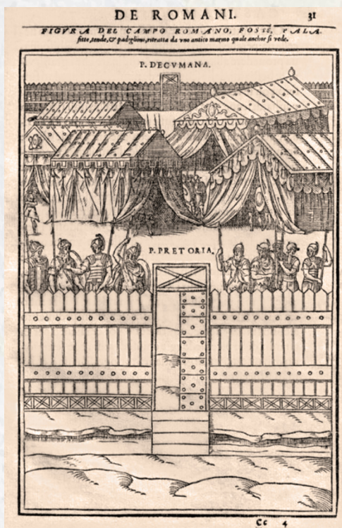
Figura 5 - Guillaume Du Choul (sec. 16.). Discorso sopra la castrametatione, et disciplina militare de Romani... , 1569

Nel trattato l'autore, oltre a descrivere le diverse aree delle terme, come il frigidarium (sala del bagno freddo), il tepidarium (bagno tiepido) e il calidarium (bagno caldo), ne analizza il ruolo culturale e sociale evidenziando come queste non